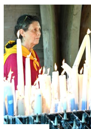
Un cierge fut déposé aux intentions de la paroisse